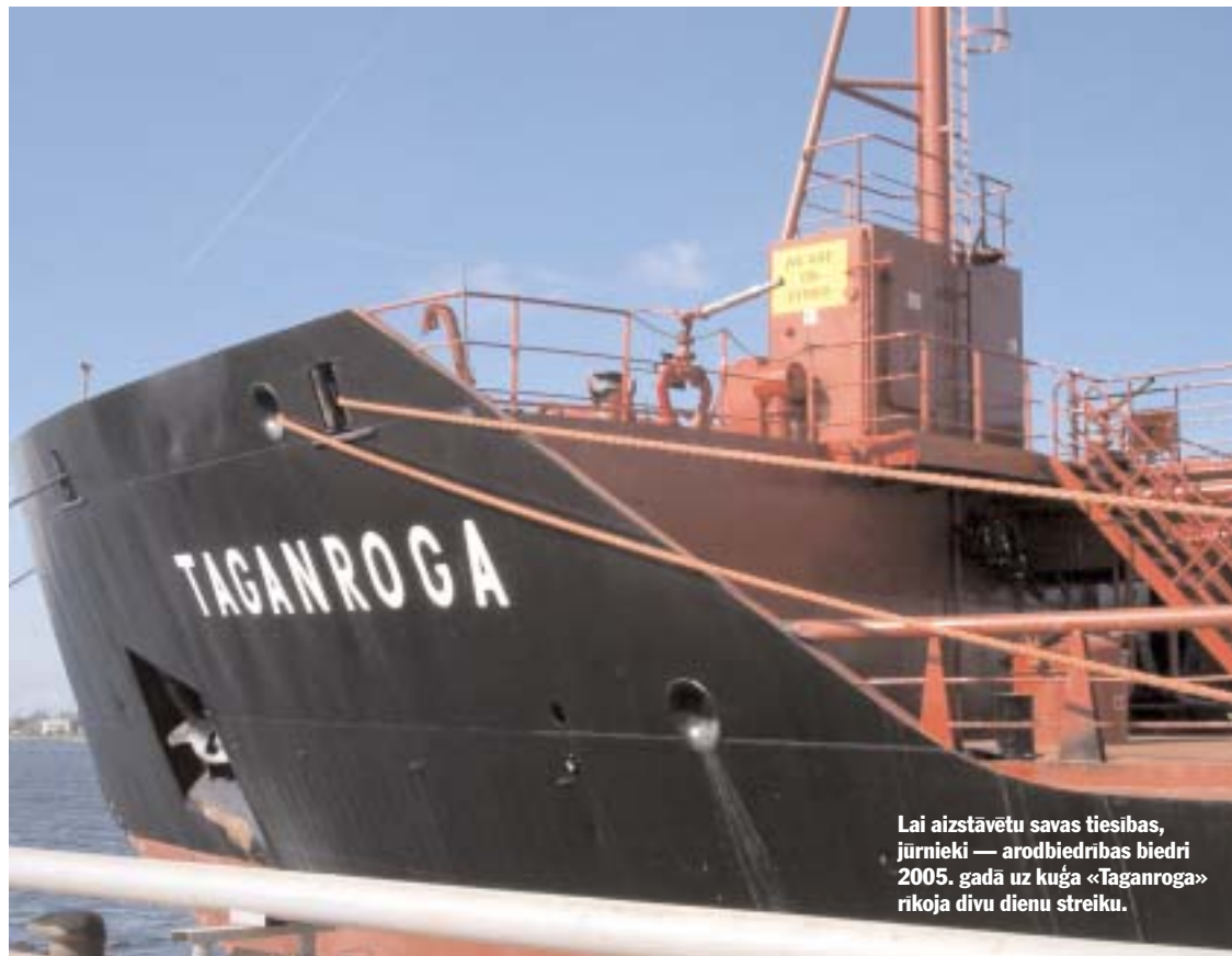
Lai aizstāvētu savas tiesības, jūrnieki — arodbiedrības biedri 2005. gadā uz kuģa «Taganroga» rīkoja divu dienu streiku.