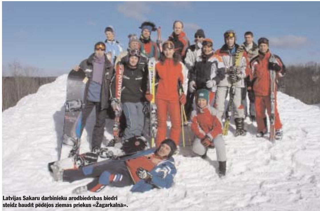
Latvijas Sakaru darbinieku arodbiedrības biedri steidz baudīt pēdējos ziemas priekus «Žagarkalnā».

Ļoti iemīļotas mūsu arodbiedrības biedru vidū ir sporta spēles — gan ziemas, gan vasaras mēnešos. Tā kā šogad par sniega trūkumu sūdzēties nevarēja, daudzi uzņēmumi